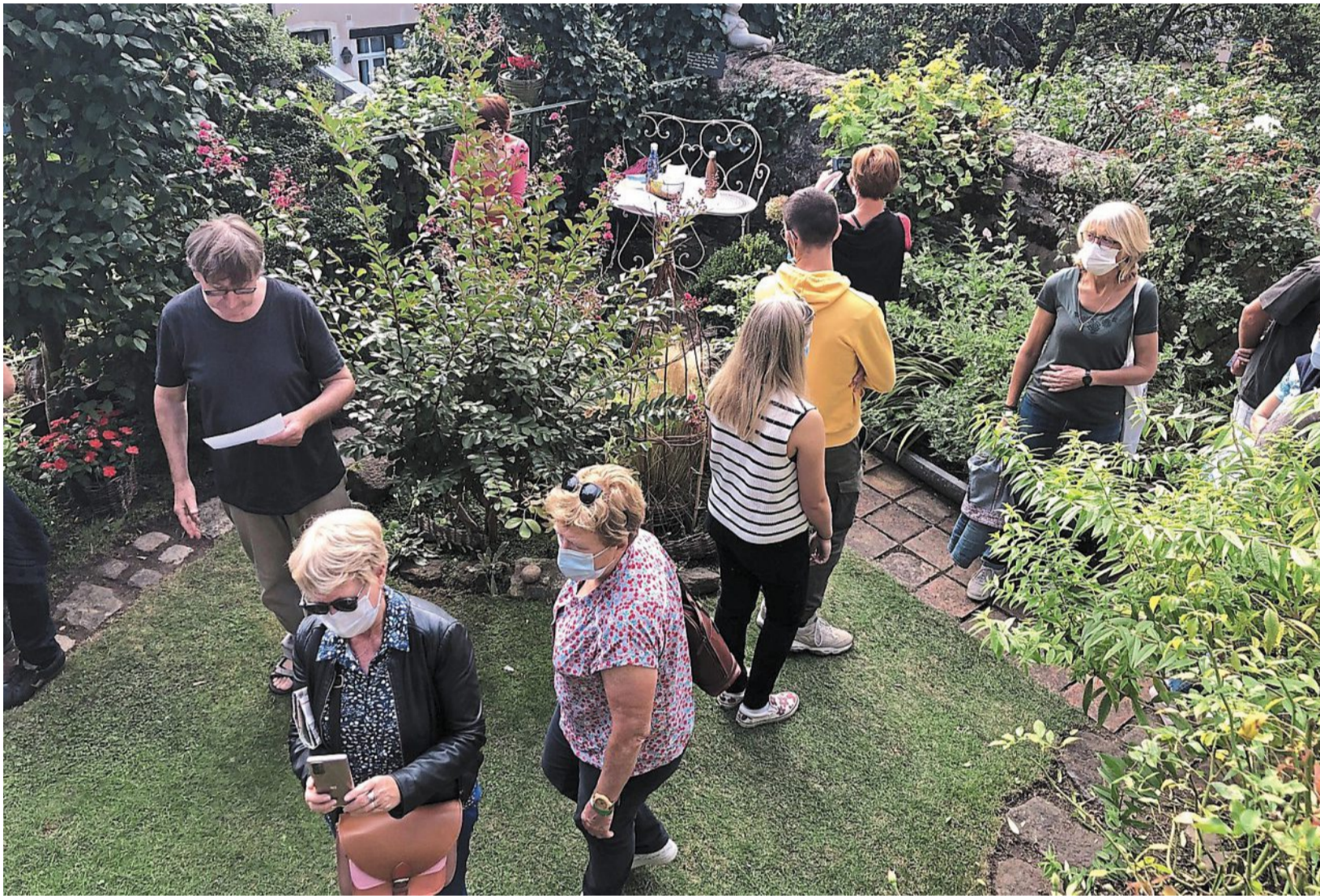
Le jardin du logis canonial Saint-Flaceau, un lieu apprécié des visiteurs d'Entre Cours et Jardins.

Ce jardin mérite d'autant plus qu'on s'y attarde qu'il accueille, pour cette édition d'Entre Cours et Jardins, une exposition étonnante de sculptures en bois géantes. « Les Land Ji sont des jeux de présence, des instruments de silence qui créent une nouvelle pratique au jardin et libèrent la créativité du corps en mouvement, la respiration et le plaisir des sens », explique l'artisan-créateur Damien Hillard. Les visiteurs peuvent s'y