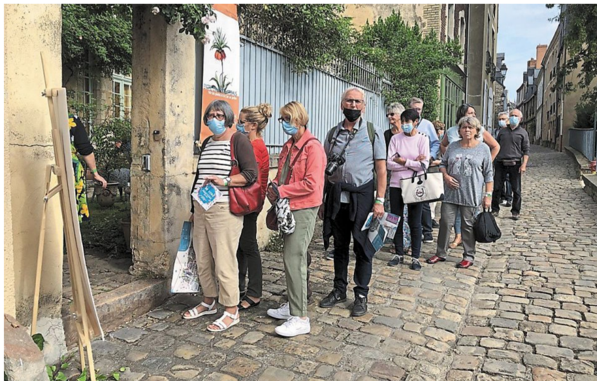
Les visiteurs curieux de découvrir les cours et les jardins cachés derrière les murs de la vieille ville.

secrets » à découvrir sur présentation du pass à 5 € (en vente place du Hallai), mais aussi dix-neuf « cours et jardins privés » en accès libre et dix jardins publics.