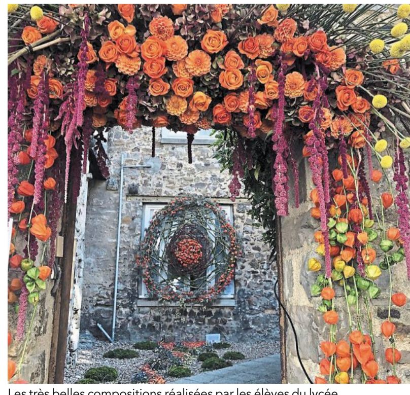
Les très belles compositions réalisées par les élèves du lycée de Ruillé-sur-Loir.